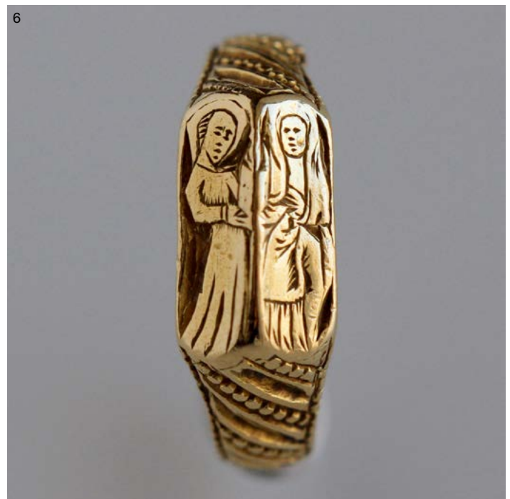
4 게스트 베드룸에서는 홀리스 시글러 Hollis Sigler의 수채화 'Living with Anticipation for Living', 'Hollis Sigler-The Party's Over'를 만날 수 있다. 5 15세기에 제작된 제단 조각 패널과 미국 미술가 돈 바움의 작품 'For Ira and Janine'(1988). 6 산드라 대표가 항상 착용하고 있는 15세기 영국 반지. 성모 마리아의 어머니와 마리아의 이미지가 새겨져 있다.