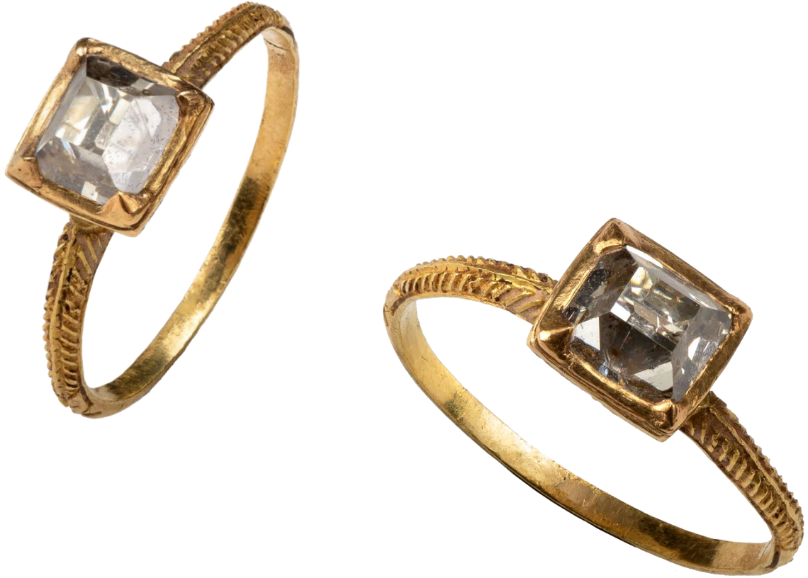
그림 3: R 1034