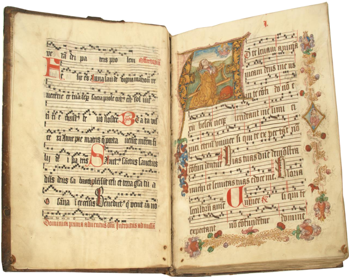
그림 2: TM 1319